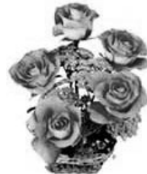
Дети, внуки, правнуки.

Целуем твои руки дорогая, Морщинки и седую прядь волос. И низко просим у Тебя прощенья, За боль и грусть, что каждый преподнес.