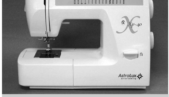
Тема выпуска: швейная машинка

* дополнительный транспортер ткани – очень по-